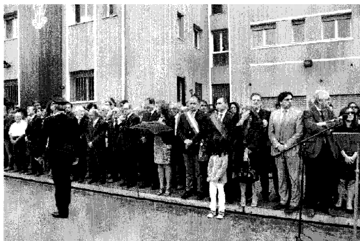
Nella foto le autorità intervenute