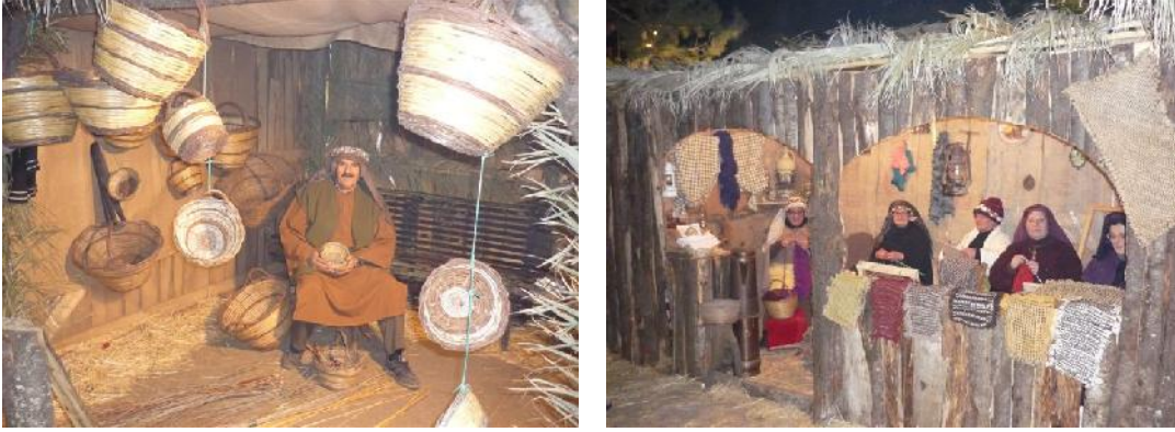
Nelle foto il “Presepe Vivente” di Pasteria