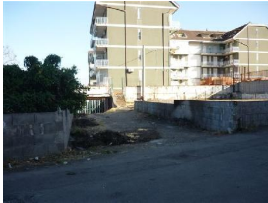
Nella foto l'area interessata nel quartiere Banco-Monteforte

E' stata dotata di un sistema di videosorveglianza l'isola ecologica in c.da Serra Manco.