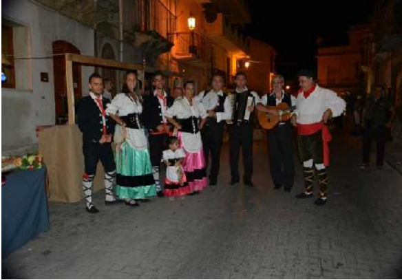
Nella foto gruppo folk itinerante