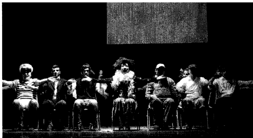
In scena il Musical per far conoscere il messaggio di Padre Puglisi