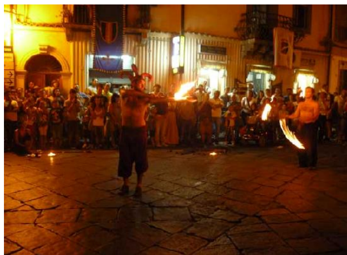
Nella foto lo spettacolo "La Sciara del Fuoco"