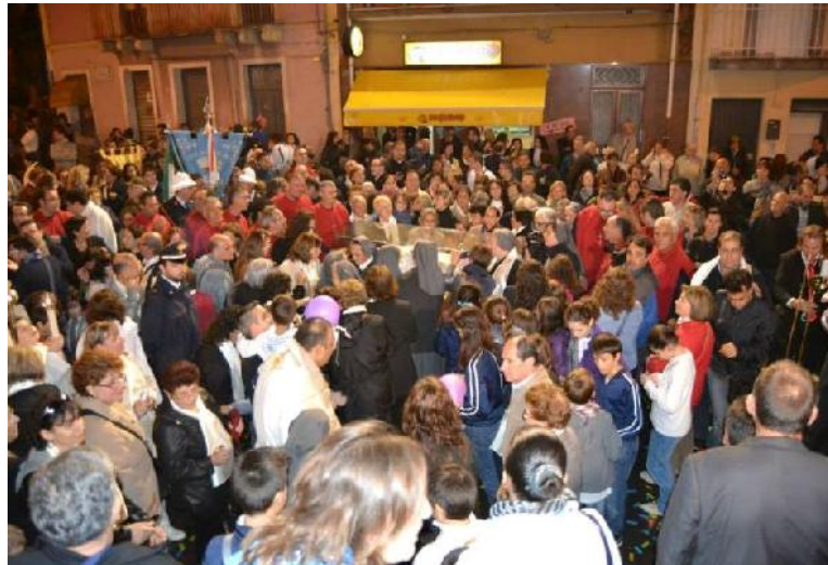
Nella foto l'ultimo saluto dei fedeli all'Urna di Don Bosco

Promosso il progetto denominato "Conoscere Calatabiano", attivato con la stipula di un Protocollo d'Intesa tra Comune di Calatabiano, Associazione Culturale "Trinacria O.n.l.u.s." di Calatabiano, Associazione Culturale "Sikania" di Fiumefreddo di Sicilia, Istituto Musicale "Joannes Brams" di Riposto, Associazione Culturale "Il Nespolo O.n.l.u.s." di Calatabiano, Ente Parco Fluviale dell'Alcantara, G.A.I. "Terre dell'Etna e dell'Alcantara", Istituto Comprensivo "G. Macherione" di Calatabiano, "Cultinvest S.r.l.", Arcipretura di Calatabiano, che ha visto, da ultimo, l'adesione anche dell'Associazione Culturale locale Promo Loco.