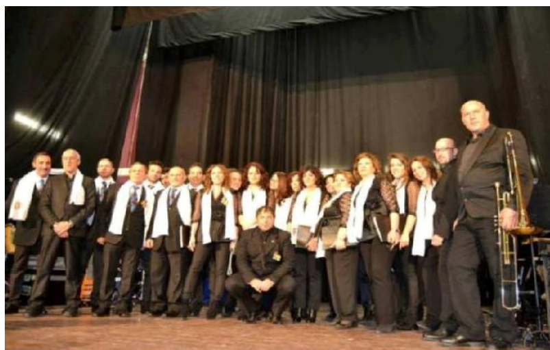
Nelle foto il coro dell'Associazione Nazionale della Polizia di Stato di Catania