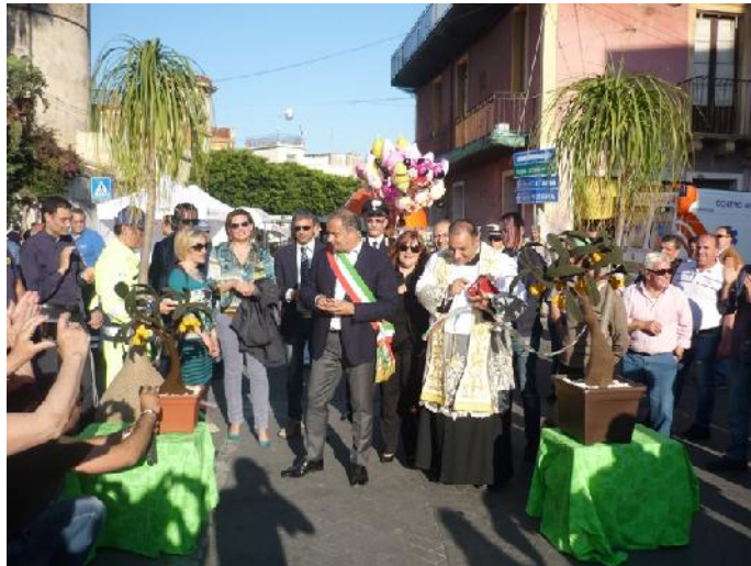
Nella foto inaugurazione della Sagra delle Nespole