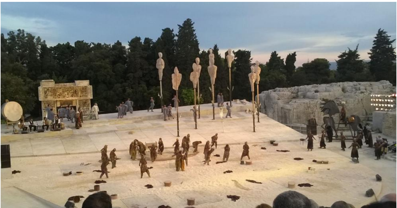
Un momento della rappresentazione delle Supplici

Anche nell'anno 2015, l'Assessorato alle politiche culturali in occasione delle tragedie greche al Teatro Antico di Siracusa, per il secondo anno consecutivo ha messo a disposizione della cittadinanza un pullman per consentire di assistere alla tragedia "Le Supplici" di Eschilo, iniziativa accolta con grande entusiasmo e partecipazione.