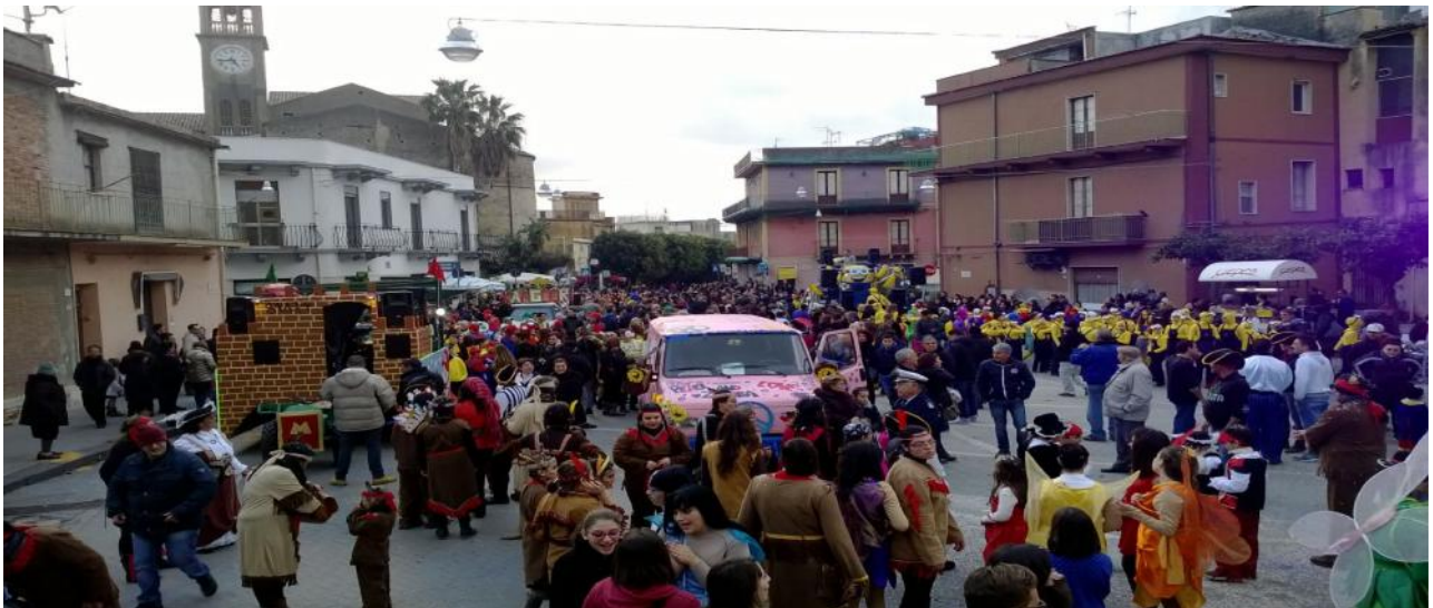
Gruppi in maschera in Piazza Mercato