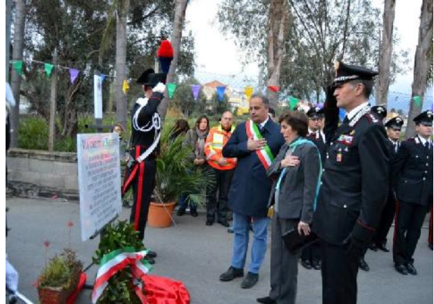
Nelle foto la cerimonia di intitolazione della via Caduti di Nassiriya

Il Comune si è mobilitato contro il “gioco d’azzardo”, aderendo al manifesto dei Sindaci per la legalità e contro il gioco d’azzardo e proponendosi di adottare ogni misura utile a contrastare il fenomeno (da azioni di tipo amministrativo, come, ad esempio, premiare le attività commerciali disposte a togliere le slot machine e i videopoker dai propri locali, attraverso una riduzione delle tasse comunali, ad interventi di sensibilizzazione tra i più giovani.). Il gioco d’azzardo, di esclusiva competenza statale, costituisce, infatti, da qualche anno una grave questione sociale, che coinvolge maggiormente le fasce più deboli, quelle con minore scolarizzazione e i lavoratori precari. Si tratta di salvaguardare la comunità, le relazioni, la stabilità economica delle stesse famiglie con giocatori patologici. L’Amministrazione Comunale è pure intervenuta per regolare gli orari delle sale da gioco, viste le continue segnalazioni da parte di famiglie che vivono, per la dipendenza di un familiare, un grave momento di disagio.