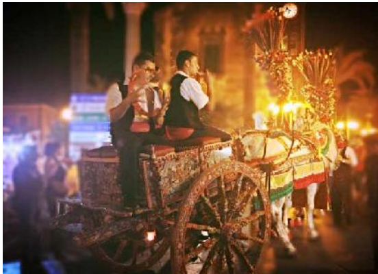
Nella foto sfilata di carretto siciliano