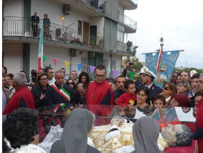
Nella foto l'incontro con l'Urna di Don Bosco accolta dai fedeli