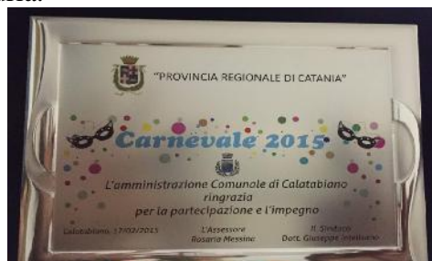
Targa per la premiazione offerta dalla Provincia Regionale di Catania

Grande entusiasmo e partecipazione per il Carnevale, organizzato dall’Amministrazione Comunale con la collaborazione di cittadini e della ex Provincia Regionale di Catania, che ha offerto i premi, nonché con il sostegno di varie associazioni locali, che ha visto la sfilata di gruppi in maschera e dei rispettivi carri allegorici premiati dalla giuria.