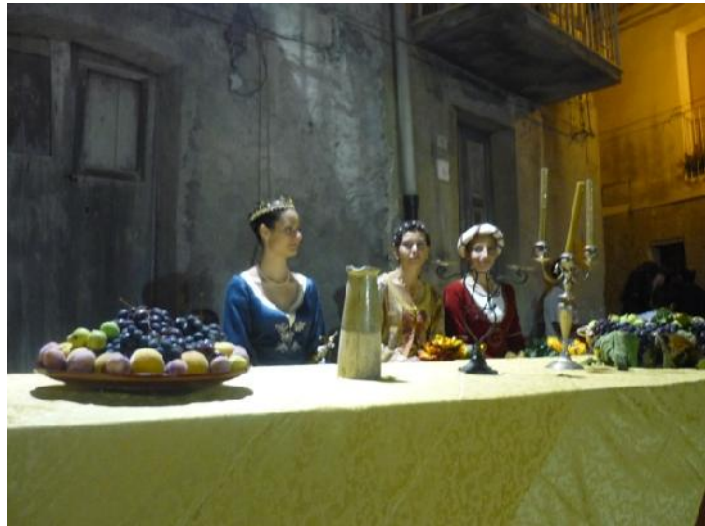
Nella foto il banchetto medioevale