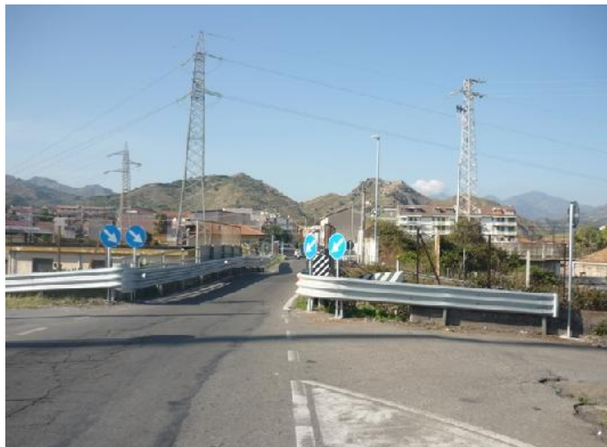
Nella foto il cavalcavia ferroviario sulla Sp 127