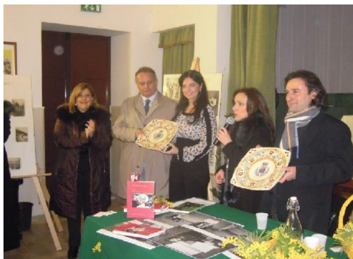
Nella foto consegna di un omaggio ad una delle relatrici

Con il patrocinio del Comune, le associazioni Rangers International Calatabiano, Avadea Onlus e Anpas, è stata organizzata la prima edizione della «2 giorni per la salute»: una serie di controlli generali gratuiti relativi al diabete e alla pressione arteriosa, a favore di chiunque lo richiedesse. Nel corso della due giornate, inoltre, è stato possibile effettuare gratuitamente il tesseramento Anpas e conoscerne la funzione ed i vantaggi.