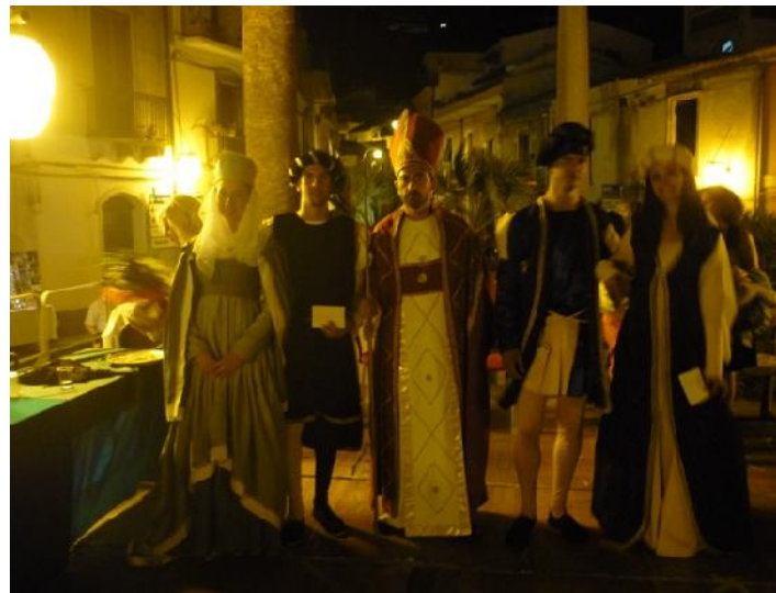
Nella foto i premiati del concorso dei costumi d'epoca

Più che positivo il bilancio della Kermesse Medioevale (Feste/Sagre Medioevali), organizzata annualmente dal Comune con la collaborazione delle associazioni locali e di privati cittadini. A tracciare un bilancio positivo sul "Medioevo Fest", il percorso affollato di turisti e appassionati (tra piazza del Mercato e via Duomo), che, provenienti da ogni dove, hanno letteralmente preso d'assalto "la città dei castelli", vedendo cavalli e cavalieri in prove di abilità, tra cui il gioco del cerchio, del paladino e della selvaggina. L'appuntamento più atteso la festa medioevale, con la performance teatrale davanti al sacro della chiesa del SS. Crocifisso (sul monte castello) ed il centro storico trasformato per l'occasione in una ambientazione medioevale, che ha visto sfilare il Corteo Storico ed esibirsi musicisti e giullari, sbandieratori e cavalieri. Apprezzati gli sforzi del direttore artistico, il cantastorie e attore Luigi Di Pino.