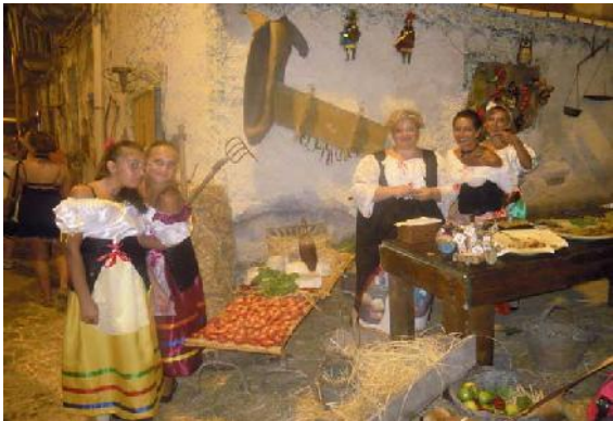
Nella foto una tipica ambientazione siciliana