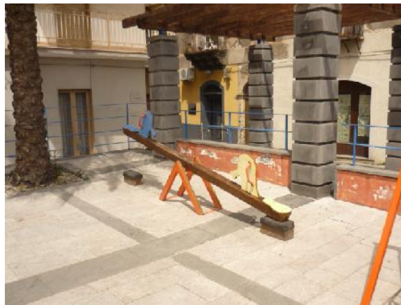
Nelle due foto i giochi per bambini recuperati nel deposito comunale

Il Comune si è adoperato al fine di poter rendere nuovamente fruibile il parco «Papa Giovanni Paolo II», nel quartiere di Banco-Monteforte, chiuso in seguito ad atti vandalici compiuti da ignoti, che avevano sfondato le porte del deposito attrezzi e dei bagni e danneggiato le vetrate e alcuni arredi. Gli interventi hanno riguardato la pulizia straordinaria e la riparazione dei servizi igienici danneggiati, la rimozione delle erbacce, la sistemazione delle aiuole, la potatura di alcuni alberi e la pulizia dei viali, l'inserimento di circa 30 nuovi corpi illuminanti lungo questi ultimi, l'adeguamento e la riparazione dell'impianto d'irrigazione con la sistemazione di alcune elettrovalvole, degli zampilli rotti delle due pesanti fontane in pietra lavica.