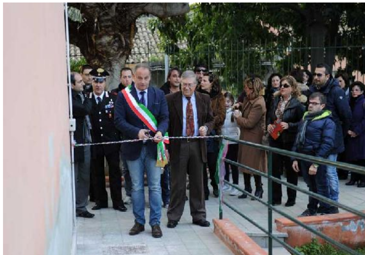
Nella foto l'inaugurazione

I lavori, con la messa in sicurezza della struttura, i cui locali si presentavano assolutamente inidonei, sia dal punto di vista igienico che della sicurezza, ad ospitare delle aule scolastiche, realizzati a tempo di record dall'impresa affidataria durante le vacanze natalizie, hanno rappresentato una delle opere più attese previste nel programma di mandato del Sindaco.