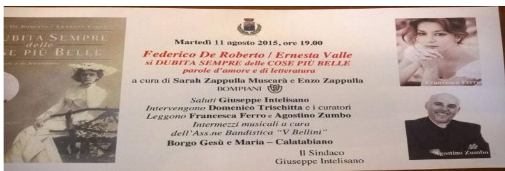
Invito per presentazione Libro “Si dubita sempre delle cose più belle”