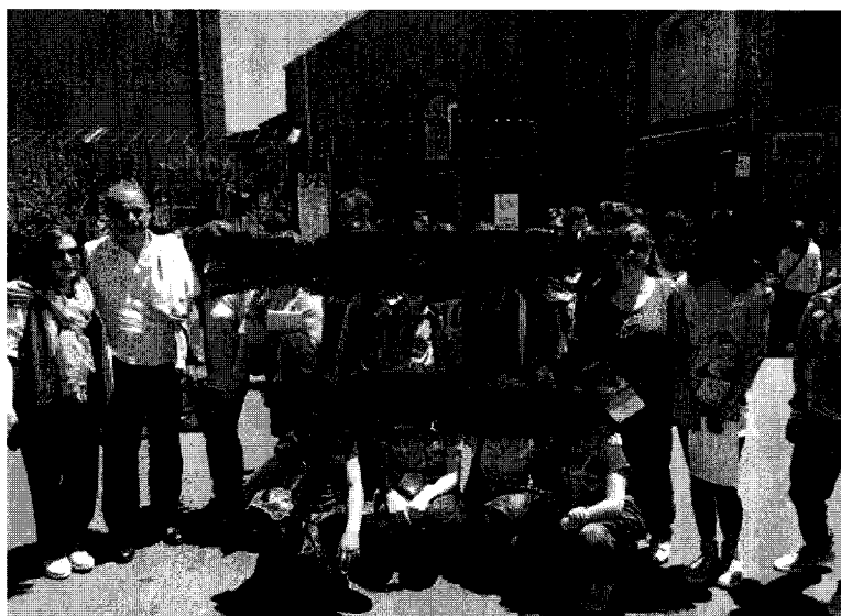
Gruppo di alunni alle Ciminiere di Catania per premiazione concorso

L'Amministrazione ha aderito al concorso letterario bandito dalla casa editrice Maimone, riservato ai ragazzi della scuola secondaria di primo e di secondo grado di Catania e Paesi Etnei, anno scolastico 2014-2015, denominato "Storie sotto il Vulcano...i ragazzi raccontano".