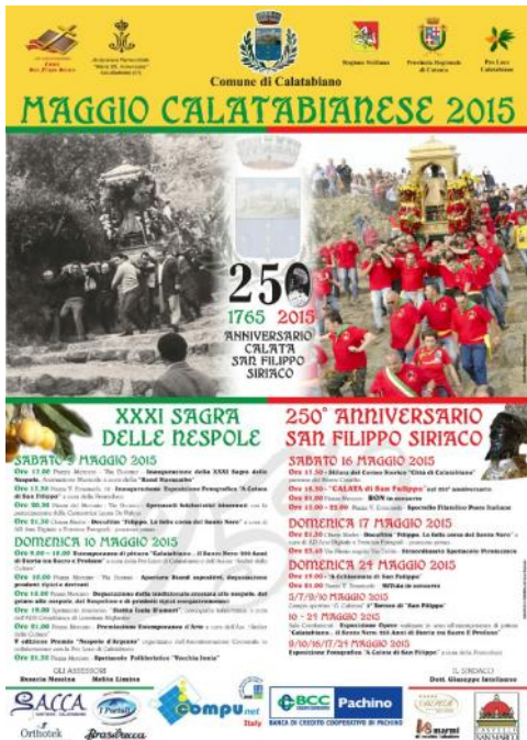
Manifesto Maggio 2015