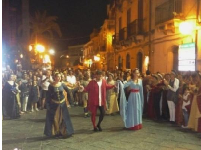
Nelle foto momenti dell'esibizione del Corteo Storico