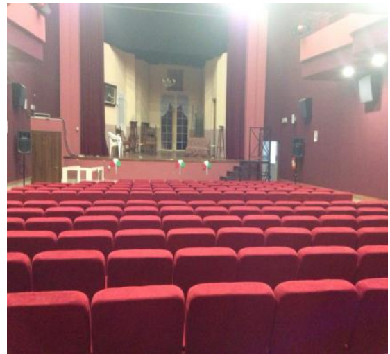
Nella foto i locali del Cine Teatro