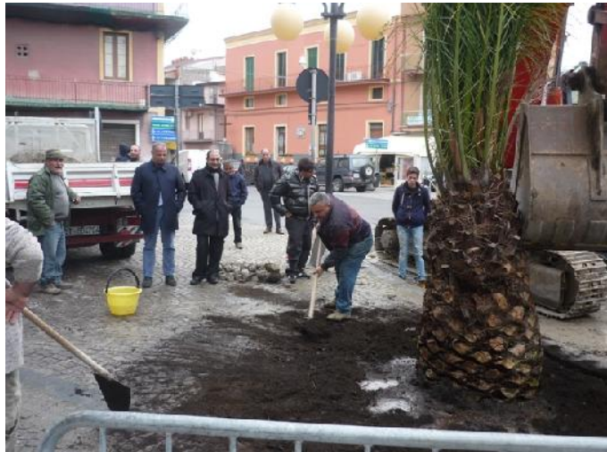
Nella foto le operazioni di piantumazione della nuova palma

Sulla scorta dei rilievi effettuati dal Corpo Forestale dello Stato, sono state individuate le aree comunali percorse dagli incendi da inserire nell'aggiornamento annuale del catasto dei soprassuoli percorsi dal fuoco, ai sensi della legge 21.11.2000, n. 353 "Legge Quadro in materia di incendi boschivi" e della rispettiva legge regionale.