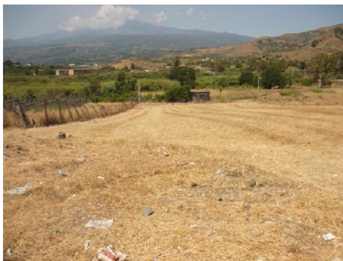
Nella foto l'area in contrada Matarazzo

Oltre ad altri immobili in precedenza confiscati alla mafia e assegnati al Comune (terreno agricolo in c.da Quadararo Sottano e casetta terrana con cortiletto retrostante ed area libera sovrastante in via Trento), per la gestione dei quali quest'ultimo aveva aderito al Consorzio Etneo per la Legalità e lo Sviluppo, nato sotto l'egida del Ministero dell'Interno, con l'obiettivo della gestione comune dei beni confiscati alla mafia e messi a disposizione della cittadinanza per finalità sociali, ulteriori beni sono stati confiscati e recentemente assegnati al Comune: immobili siti in via Cavour, 60-62-63 ed immobile sito in via Petrarca, n. 37 da destinare rispettivamente ad uffici pubblici e per finalità sociali.