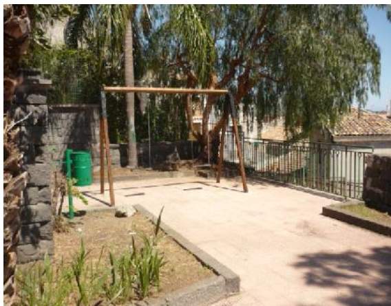
Nella foto l'orto botanico nel quartiere di Gesù e Maria

Intendimento dell'Amministrazione sarebbe stato anche quello di concedere gratuitamente le aree a verde a chi ne avrebbe fatto richiesta per adottarle e renderle pulite a costo zero per l'Amministrazione Comunale.