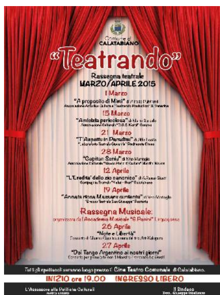
Locandina stagione teatrale 2015

E' stata promossa, anche nell'anno 2015, dall'Amministrazione Comunale in collaborazione con diverse Associazioni Culturali, l'organizzazione di una rassegna teatrale denominata "Teatrando", riscuotendo grande successo di pubblico.