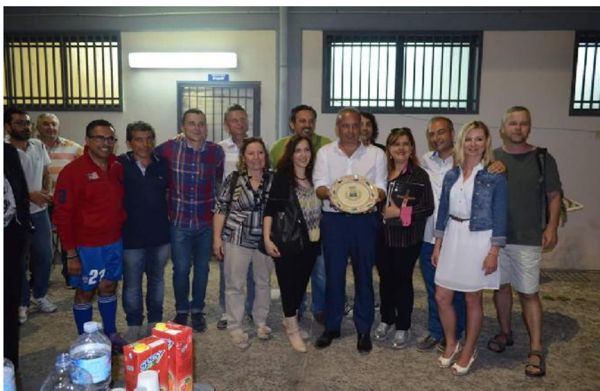
L'Amministrazione omaggia il gruppo di studenti e professori del Liceo di Olkusz (Polonia)

La cittadina di Calatabiano ha ospitato la “Bimbimbici”, giunta alla XV edizione: Giornata Nazionale promossa dalla Fiab-Federazione Italiana Amici della Bicicletta-patrocinata dal Coni e dal Ministero dell’Ambiente e della Tutela del Territorio e del Mare, una gioiosa pedalata in bicicletta per le vie del centro abitato, a cui hanno partecipato un centinaio di bambini, dai cinque agli undici anni accompagnati dai loro genitori. Alla riuscita dell’iniziativa, con l’obiettivo di sensibilizzare istituzioni e opinione pubblica sull’importanza di limitare l’uso e il numero di auto in circolazione e di promuovere spostamenti sicuri a piedi e in bicicletta, specie nei percorsi casa-scuola e casa-lavoro, hanno collaborato, accanto al Comune, l’A.s.d. “Fausto Coppi”, la Parrocchia Maria SS. Annunziata, l’Istituto Sacro Cuore e l’Istituto Comprensivo “G. Macherione”. A conclusione dell’iniziativa, premiati, con delle targhe ricordo, gli alunni vincitori del Concorso Nazionale per le scuole, con temi e poesie sulla mobilità sostenibile, la qualità della vita odierna, la città come luogo sicuro per giocare; mentre, ai partecipanti alla “Bimbimbici” è stato consegnato un attestato di partecipazione.