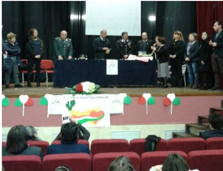
Foto con i relatori e Amministrazione Comunale