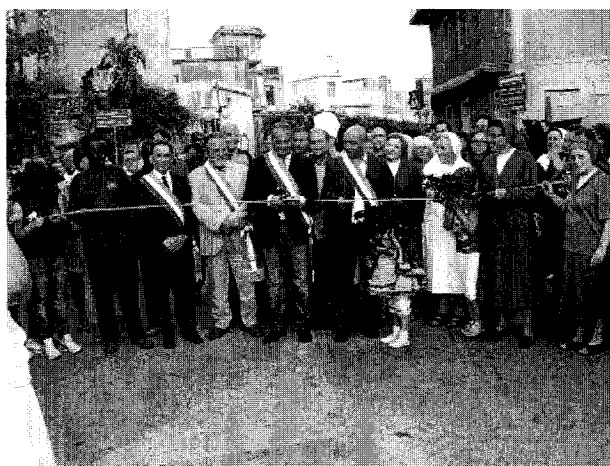
Nella foto il taglio del nastro manifestazione “Città delle Professioni”

Predisposti i regolamenti di assistenza igienico-personale, erogata anch’essa tramite l’utilizzo del sistema di accreditamento, sotto forma di voucher , ed il regolamento per il rimborso spese viaggio disabili ed attivato il Progetto: “Servizio di educativa domiciliare minori”.