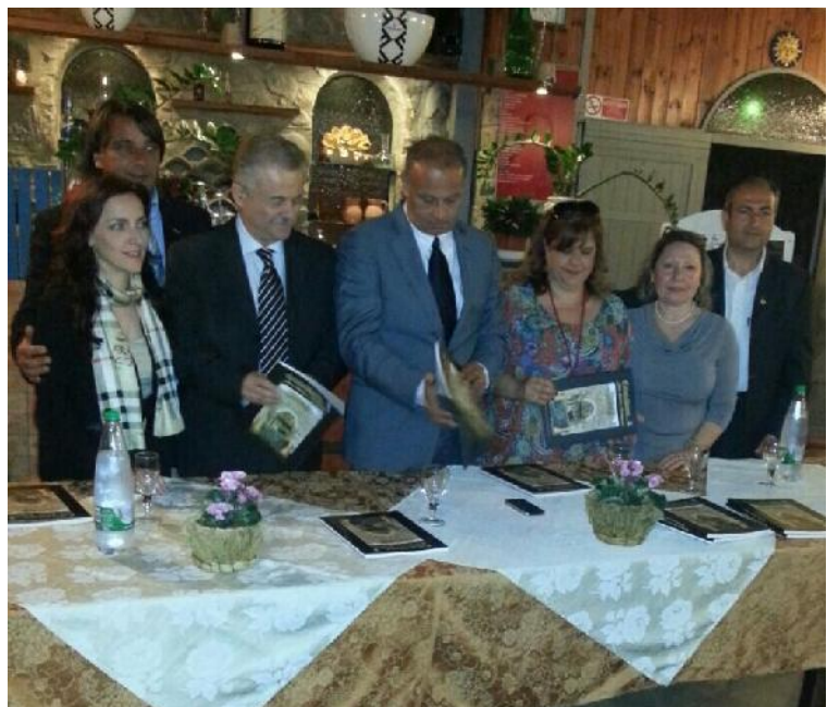
Presentazione Volume "Calatabiano...Fede, Storia e Tradizioni"

Con il patrocinio del Comune e della ex Provincia Regionale di Catania, si svolge sulla Spiaggia di San Marco da ben 12 edizioni la "Festa dell'Aquilone". La manifestazione negli anni ha registrato sempre una più crescente partecipazione di bambini e appassionati, provenienti da diverse località. Protagonisti assoluti gli aquiloni, sotto gli sguardi divertiti dei bambini e dei bagnanti, che hanno assistito, numerosi, alla festosa e coloratissima baraonda che accompagna l'evento organizzato dalla Pro Loco. A tutti i partecipanti sono stati donati medaglie e vari regali.